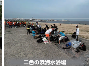
二色の浜海水浴場