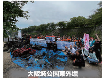
大阪城公園東外堀