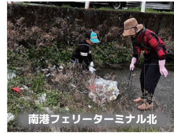
南港フェリーターミナル北